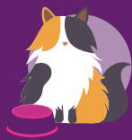
Contrôle du poids